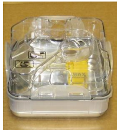
38777 Vattenbehållare Till befuktare H5i