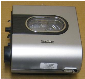
38773 Befuktare H5i