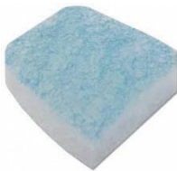
38737 Filter 2 st/fp