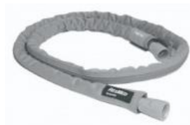
38766 Slangvärmare Standardslang