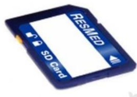
38728 SD-kort S9