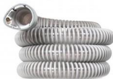
38735 Luftslang 2 m 38904 Luftslang 3 m