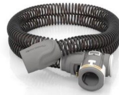
38754 ClimateLine slang