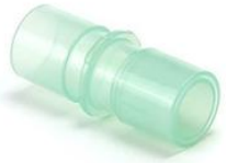
43469 Sammanbindningsrör 22M-22M/15F