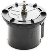
39473 Kretsadapter för enkel-slangset Vivo 60