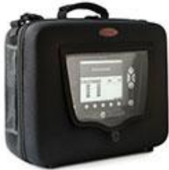
39466 Transportväska Vivo 50/60