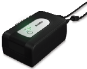
39576 Astral externbatteri