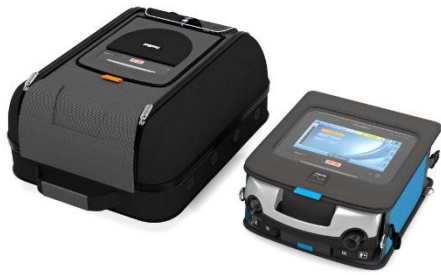
39450 Astral Mobility Bag 39456 Astral Slim Fit Bag