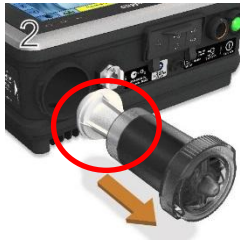
39341 Luftfilter, 4 st/fpk