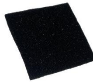
39334 Filter tvättbart Grå. Diskas 1 ggn/vecka, byts 1 ggn/år