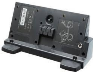
39461 Click-on batteri Vivo 50/60