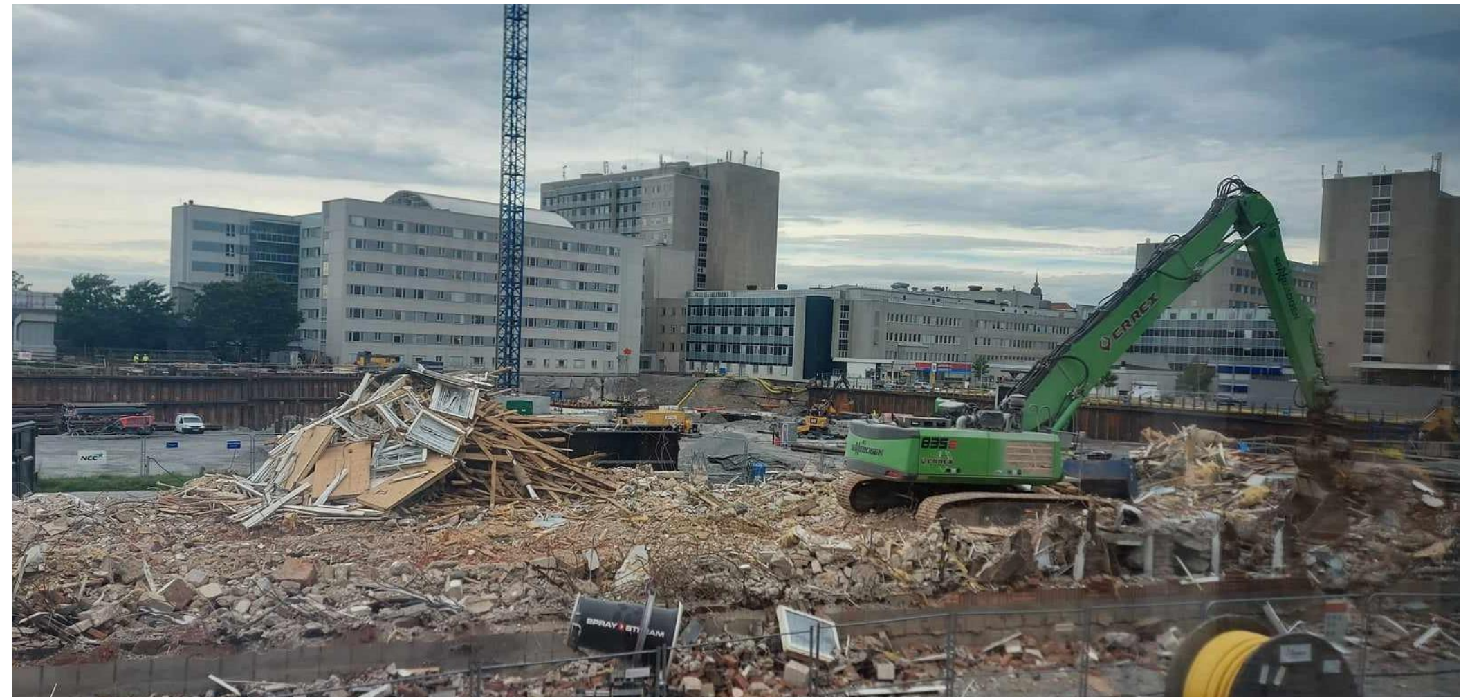
Rivningen av program akutsjukhusets kontor blev klart under slutet av september. (ingång 39).