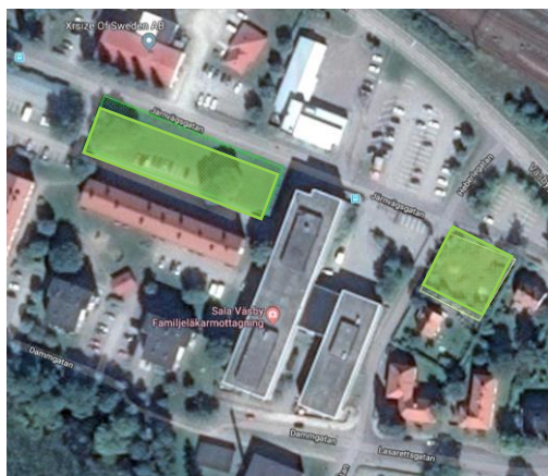
De grönmarkerade ytorna blir nya parkeringar

Markentreprenören har kommit långt med färdigställandet av de nya parkeringarna. De nya parkeringarna för personalen finns markerade i figuren nedan.