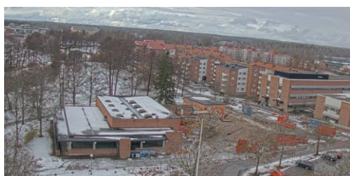
Bild tagen av webbkameran. Till vänster syns matsalen. Den är nu sanerad och snart ska även den rivas.

Nu är inte mycket kvar av gamla matsalen och pann- och driftcentralen. Rivningen går i ett rasande tempo och det är mycket som händer varje dag. Det är spännande att följa arbetet på plats, men har du inte möjlighet att göra det så kan du besöka www.kamera.byggdialog.se . Sidan uppdateras kontinuerligt, dygnet runt.