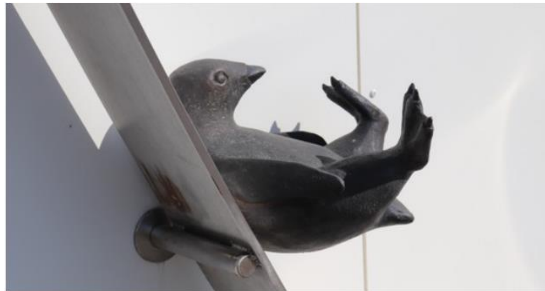
Konstverket Pingvinakuten av Eva Fornåå kan ses vid entrén till akutmottagningen i Västerås.